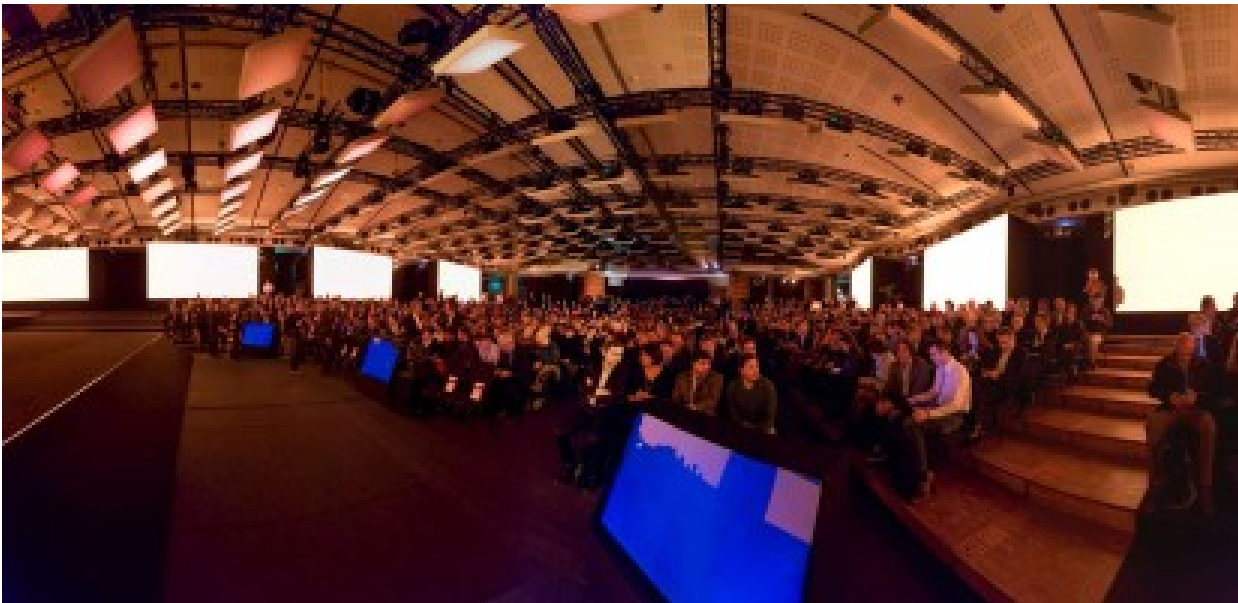
L'audience du Show Hello ? L'écosystème d'Orange avec partenaires logiciels et matériel, fournisseurs de contenus, régulateur (ARCEP), médias, etc.

Le Show Hello avait lieu au Carrousel du Louvre. Une grande salle dimensionnée pour un millier de personnes utilisée le matin pour l'écosystème de l'opérateur (partenaires, grands clients, institutionnels, médias) et l'après-midi pour les salariés (en fait, les top managers). Un showroom permettait de découvrir la trentaine des solutions annoncées dans le keynote. C'est toujours très dense. Derrière les paillettes du keynote et des démos, il faut toujours gratter un peu, ce que je vais faire ici.