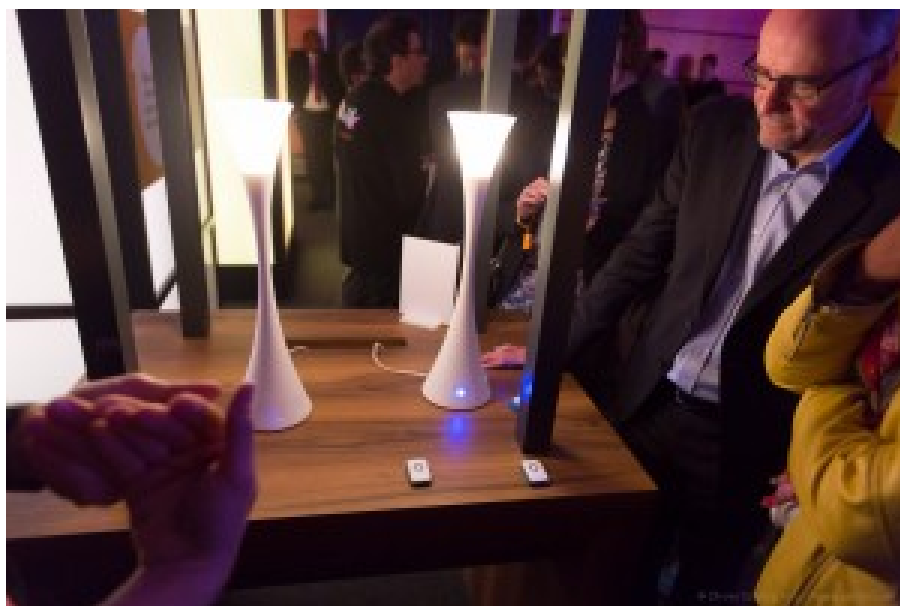
Les lampes répéteurs LoRa qui seront proposées par Orange. Avec des voyants dont la sémantique dépendra des applications.

Pour améliorer la couverture en intérieur, Orange propose une lampe de son cru dotée d'un design moderne et surtout d'un répéteur LoRa. Elle permet notamment d'améliorer la réception en sous-sol. On peut dire que le réseau LoRa est "horizontal" et que le répéteur permet de créer un réseau "vertical" chez soi. Ce n'est pas pour autant une solution de réseau mesh où chaque répéteur serait en relation avec d'autres répéteurs pour étendre la portée du réseau au-delà du logement comme le propose Archos avec ses prises PicoWAN, aussi basées sur la technologie LoRa. Orange parle de réseau "en étoile".