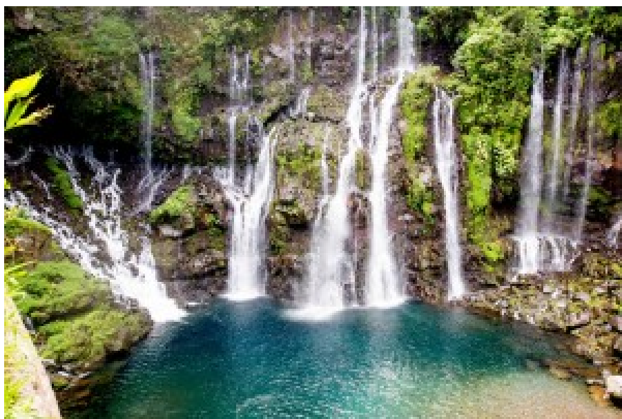
Les chutes d'eau du Grand Galet qui illustrent l'abondance de ressources hydriques dans la Réunion.

Les handicaps ? Comme presque partout en Outre-Mer, le territoire est fragile économiquement avec un taux de chômage élevé. Il est ici aux alentours de 30% dont 60% chez les jeunes. 40% de la population a moins de 25 ans car la natalité est forte. Le chômage y est bien pire que le Maghreb au moment du printemps arabe et cela n'explose pas pour autant. Nous y avons 220 000 emplois, 120 000 chômeurs, 250 000 enfants scolarisés et 80 000 foyers éligibles au RSA. 250 000 personnes sont dépendantes du RSA. 28% de la population adulte est illettrée soit 100 000 personnes. En gros, 220 000 personnes en font vivre 620 000. Les amortisseurs sociaux et le secteur public servent d'anesthésiant mais la réserve d'anesthésiant s'amointrit. Autre inconvénient évoqué sur place : l'enregistrement d'une société et l'obtention de son KBIS dure des mois. Un problème que l'Etat pourrait régler sans que cela coûte les yeux de la tête.