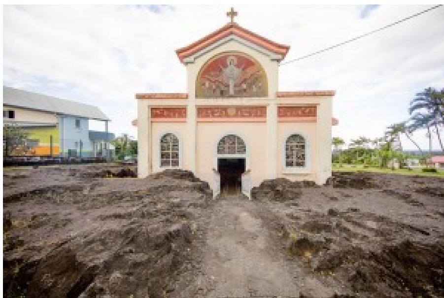
L'église Notre Dame des laves évoque la résilience de La Réunion. Elle a résisté à une coulée de lave en 1977.

La dépendance énergétique de l'île est pour l'instant de 85%. Les énergies renouvelables sont au programme pour réduire cette dépendance, d'où quelques entreprises dans ce secteur, dans le solaire comme l'éolien, et une volonté politique d'atteindre l'autonomie énergétique d'ici 2030. Le gasoil est à 91c et au même niveau dans toutes les stations services contre plus de 1,04€ en métropole en ce début avril 2016. La TIPP ou la TVA doivent être plus basses. Le pétrole raffiné provient de Singapour via une ou deux navettes de tankers de petit tonnage.