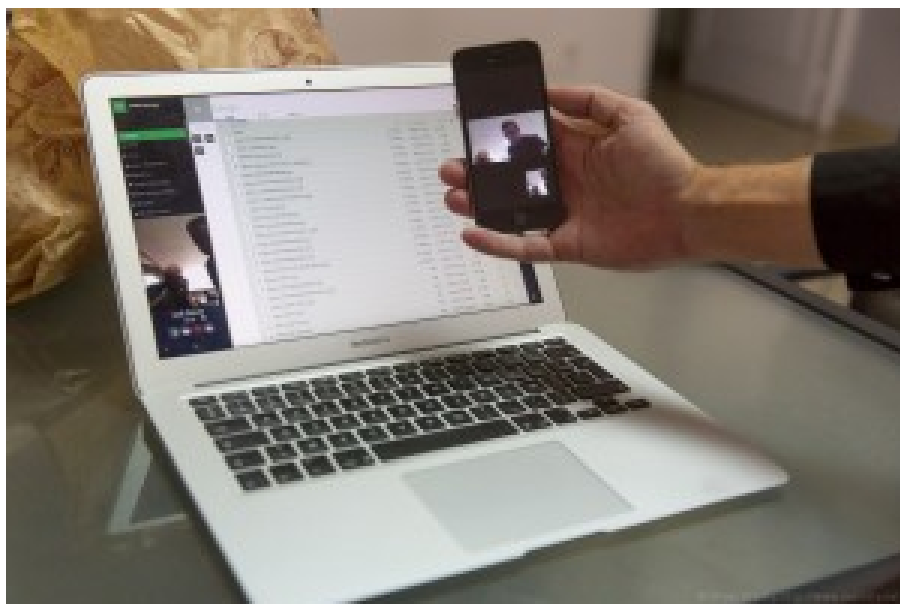
L'application Places d'Ansam permet de lancer une visio-conférence à partir de son micro-ordinateur et vers un smartphone, le tout en étant crypté.

logiCells est une société de développement d'applications métiers qui est aussi en train de faire sa mue vers l'édition de logiciel. Créée par Anil Cassam Chenai (un polytechnicien), elle est en train de mettre au point un "ERP sémantique" qui rassemble les fonctions d'un ERP (entreprise resource planning), d'un ECM (content management) et d'un CRM (relation client), le tout s'appuyant sur la capacité de gérer les données structurées et non structurées et de les exploiter pour identifier via du machine learning les déviations par rapport à la normale, les clients à risque ou à problèmes, ou pour segmenter les clients. Le tout avec un système d'auto-apprentissage. Ca a l'air prometteur sachant que le concept n'est pas évident à vulgariser. L'équipe de la société est répartie sur La Réunion, l'île Maurice avoisinante, Montpellier, Bordeaux et Paris.