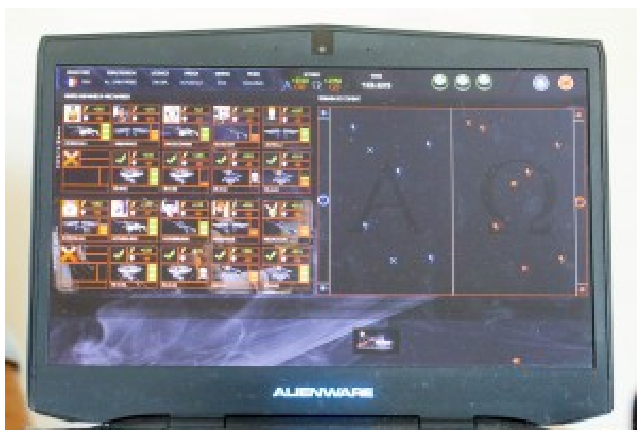
Le tableau de bord du jeu IOBlast positionnant joueurs et drones sur un terrain.