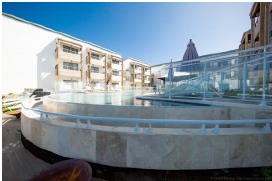
Un bel hôtel en bord de mer à Saint Pierre.

La dépendance énergétique de l'île est pour l'instant de 85%. Les énergies renouvelables sont au programme pour réduire cette dépendance, d'où quelques entreprises dans ce secteur, dans le solaire comme l'éolien, et une volonté politique d'atteindre l'autonomie énergétique d'ici 2030. Le gasoil est à 91c et au même niveau dans toutes les stations services contre plus de 1,04€ en métropole en ce début avril 2016. La TIPP ou la TVA doivent être plus basses. Le pétrole raffiné provient de Singapour via une ou deux navettes de tankers de petit tonnage.