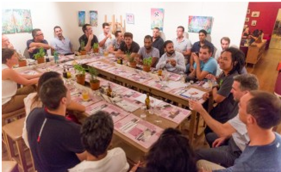
Lors du meetup Startup and Beer organisé par un entrepreneur hébergé à la Technopole de Saint Denis, chacun pitchait son projet en une minute.

La Réunion peut aussi et surtout investir en compétences, comme dans le développement logiciel. Cette compétence est rare dans le monde et, d'où qu'elle vienne, elle est la bienvenue. Et le développement logiciel est plus facile à réaliser à distance que de nombreux autres métiers. L'enseignement supérieur doit aussi travailler au rapprochement des disciplines et encourager, par exemple, les projets de fin d'étude associant filières commerciales, design et techniques.