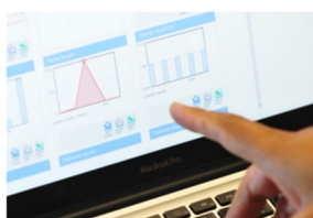
Central Management & Multichannel