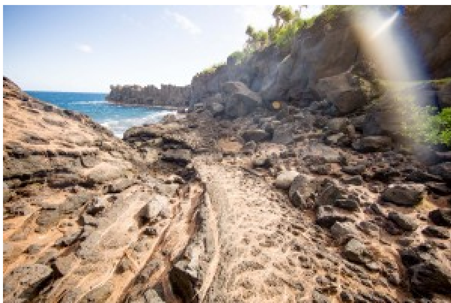
Au Cap Méchand au sud de l'île, on peut observer de près les traces des éruptions volcaniques et coulées de lave du passé.

La Réunion est une île de 2512 km 2 située à 700 km à l'est de Madagascar et à 170 km au sud-ouest de l'île Maurice dont la taille est voisine. L'île est montagneuse avec un sommet à 3071 m (piton des Neiges). On y trouve un volcan : le piton de la fournaise et des coulées de lave anciennes et récentes au sud de l'île, dans sa zone la moins habitée. C'est un volcan actif mais non explosif, donc sans danger pour la population. L'île a la forme d'une ellipse d'environ 80 km sur 50 km. Son sud est la partie la plus méridionale de la France sur la planète, si l'on met de côté les Terres Australes Françaises en Antarctique qui n'ont qu'à peine 200 habitants, principalement des scientifiques.