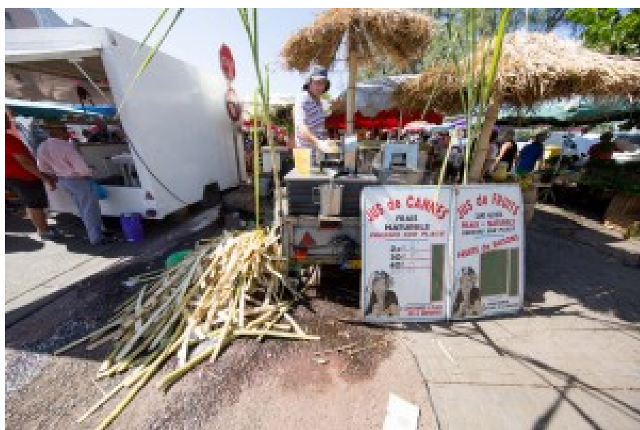
Production de jus de canne sur le marché Saint Pierre. La culture de canne à sucre subsiste encore à La Réunion. Elle est notamment transformée en Rhum.

L'économie de La Réunion s'est d'abord lancée avec un programme de construction à partir de 1946. Elle s'est véritablement développée dans les années 1970 et 1980 : création de la première université, développement du tourisme qui est maintenant un important secteur économique, développement des infrastructures et des logements. L'agriculture s'est diversifiée avec des cultures maraîchères et de la pêche.