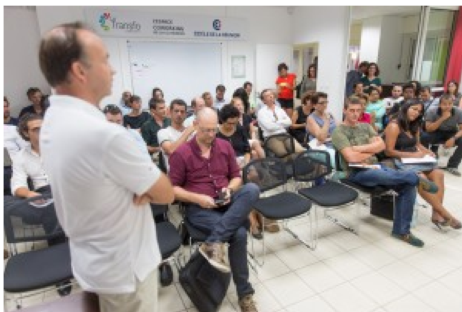
L'audience de ma conférence à Saint Pierre, en tout plus de 50 personnes. J'y faisais le point sur la dynamique entrepreneuriale en France et ses récents développements. Et leur donnais quelques recommandations pour lancer et développer sa startup à partir de la Réunion.

J'ai eu l'occasion de rencontrer divers responsables de ces structures d'accompagnement.