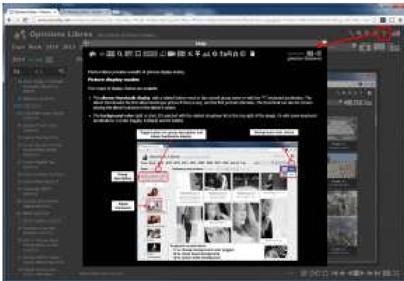
L'interface de Phofo-Folders tourne en anglais et en français. L'aide en ligne est disponible dans ces deux langues.

Je ne fais ici qu'effleurer la périmètre du plugin. Il est très riche avec notamment tout un tas de fonctionnalités destinées à l'administrateur du site.