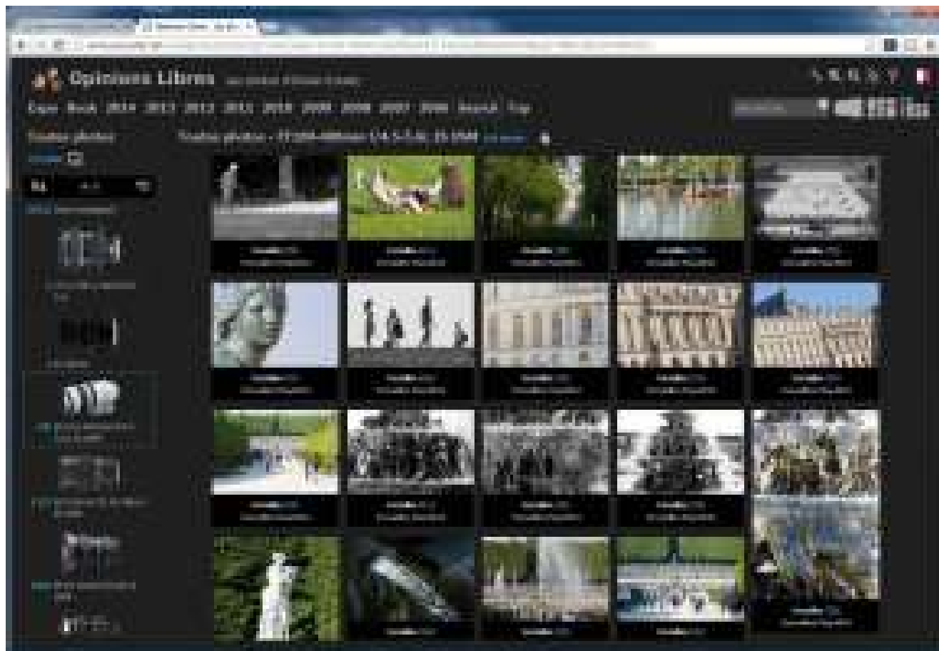
Utilisation de la fonction de recherche pour afficher toutes les photos triées par optique.