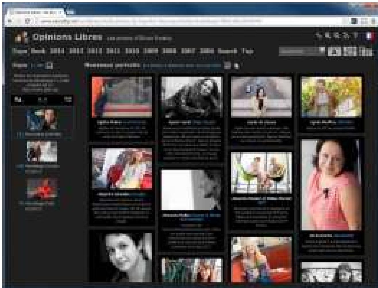
La page d'accueil du plugin Photo-Folders, pointant ici sur les dernières photos de "Quelques Femmes du Numérique !".