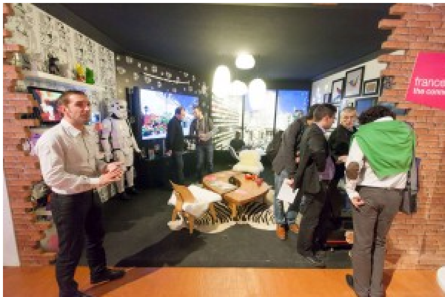
Le stand de France Télévisions à la conférence Leweb 2012, presque exclusivement dédié à des présentations de solutions de startups françaises.

Le “best practice” le plus notoire dans le co-marketing se retrouve dans les actions terrain et marketing qui apportent une présence internationale à la startup. Cela peut venir de groupes français très exportateurs ou de groupes étrangers qui donnent une visibilité internationale aux startups françaises.