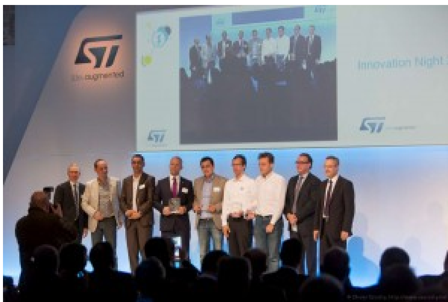
Dans les composants électroniques, le franco-italien STMicroelectronics a aussi lancé son programme startups. Ici, au moment de son lancement en juin 2013. La société donne de la visibilité à un grand nombre de startups françaises dans sa suite du CES de Las Vegas.

Le développement international peut cependant être une promesse intenable. En effet, si les filiales sont bien disposées à aider les startups de leur pays, les autres filiales du même groupe international sont bien moins motivées, sauf si la startup a déjà une belle notoriété. C’est particulièrement vrai du travail avec les équipes commerciales locales.