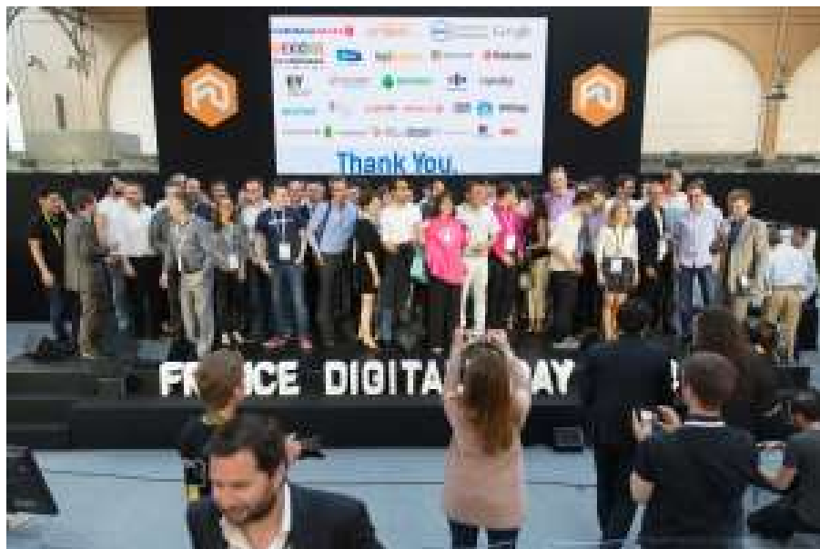
Le slide de remerciement de France Digitale Day en juin 2014 avec les sponsors et notamment Criteo, Google, France télévisions, Microsoft, Rakuten, EY et quelques nouveaux venus dans ce genre d'événement tels que Carrefour et Lagardère.

Au nez, une fois sur deux, Orange est sponsor de ces concours. C'est l'entreprise qui dispose visiblement du plus gros budget marketing en France dans le numérique. Il est donc dispersé sur un tas d'opérations. Les organisateurs ne se plaignent pas !