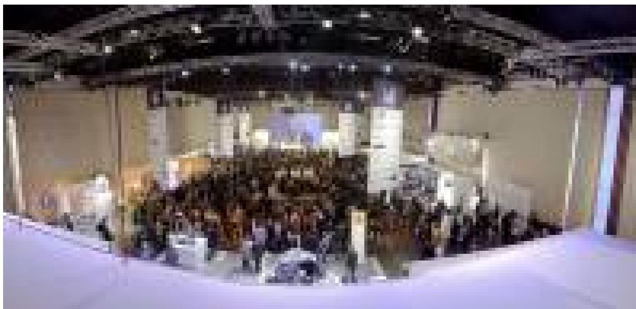
L'un des zones de stands de grandes entreprises sponsors à Leweb dans le dock Eiffel à Aubervilliers, ici en 2010.

Dans la même lignée que pour les concours de startups, de nombreux grands groupes sont les sponsors obligés de conférences et séminaires sur entrepreneuriat. Il n’y a d’ailleurs pas de conférences sans sponsors. Soit que cela permette d’accueillir gratuitement les participants, soit de cofinancer l’opération avec ces derniers. Dans des événements tels que Leweb qui a lieu en décembre à Paris tous les ans depuis 2006, on a à la fois un ticket d’entrée assez élevé pour les participants d’entreprises (2390€) mais des tarifs très modulés pour les étudiants, développeurs freelance et les entrepreneurs (290€ à 790€ selon les cas). Sans compter les médias accrédités qui sont invités. Les sponsors couvrent donc en partie les frais de ces participants qui ne payent pas plein pot.