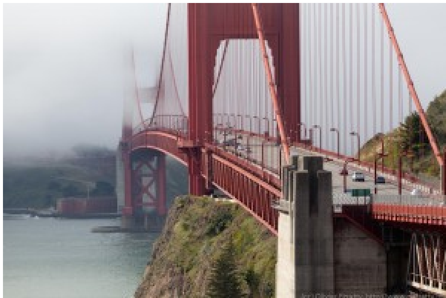
San Francisco, lieu de convergence des startups et aussi des grands groupes et leurs labs de veille technologique.