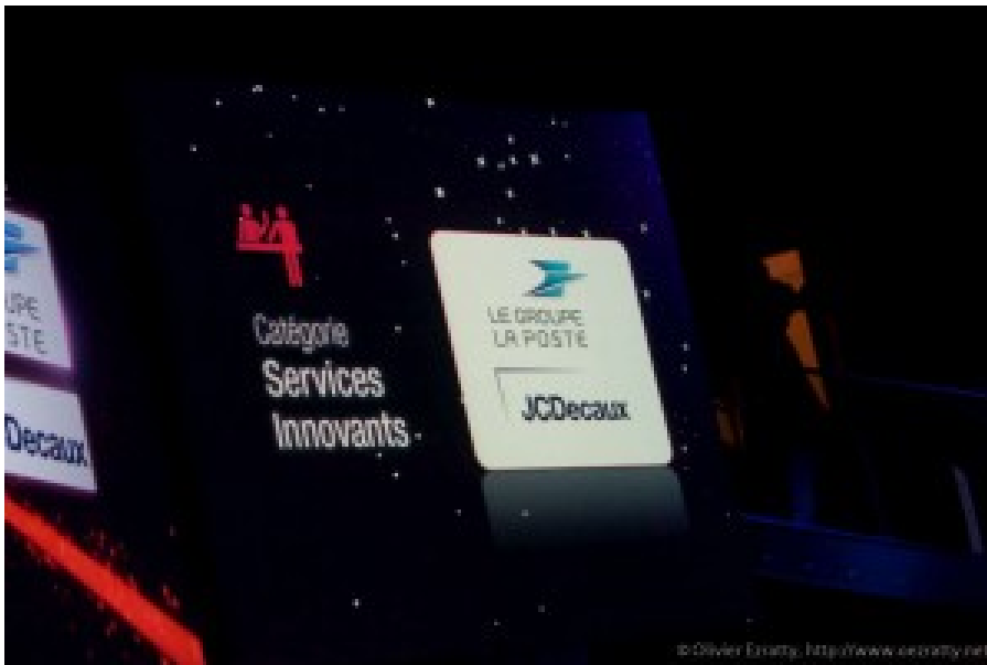
Quelques sponsors des Grands Prix de la Ville de Paris (ici en 2011).

Orange , et Bouygues Telecom ont organisé de leur côté des concours d'applications mobiles tirant parti de la 4G. SFR n'est pas en reste avec son concours SFR Jeunes Talents Start-up qui est multi-sectoriel. Le gain de ces concours ? De la visibilité, des moyens techniques et commerciaux, du référencement dans les services achat.