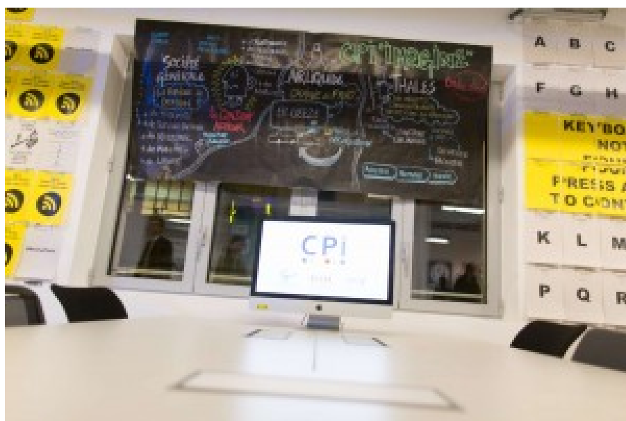
Une zone de l'espace de coworking du NUMA le jour de son inauguration en novembre 2013. Les grandes entreprises peuvent y prendre pieds pour soutenir différentes activités des startups, comme Google et son studio vidéo.

(Paris), qui a été financé par Google, Orange, BNP-Paribas et la SNCF pour ne citer que quelques exemples. Des usual suspects que l'on retrouvera souvent dans la suite de ces pratiques d'innovation ouverte. Google a d'ailleurs installé son propre espace au NUMA qui héberge Le Camping avec un "Android Devices Lab" et un studio vidéo accessible par les startups de NUMA. C'est une approche astucieuse qui permet, avec un investissement moindre, d'être présent là où circulent un grand nombre de startups. L'autre approche, moins courante, consiste à sponsoriser ou aider les incubateurs des grandes écoles. Moins courante car ils sont très dispersés et hébergent chacun un nombre réduit de startups, à l'exception peut-être de l'incubateur de Télécom Paristech rue Darreau à Paris.