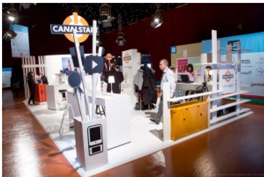
Stand de Canal+ pour le lancement de son programme startups CanalStart à Leweb 2013. Dommage, il n'y avait aucune startup de valorisée sur ce stand alors pourtant que Canal+ fait appel à certaines d'entre elles (Spideo, Cognik, ...).

Orange et Canal+ développent des formules d'accélération de startups (Orange Fab et CanalStart), mais sans l'hébergement. Cela consiste en l'accompagnement de projets et la mise en relation avec les équipes de l'entreprise pour mener à bien des projets en commun. C'est une logique de sourcing d'innovations plus que d'écosystème.